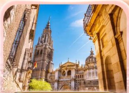
มหาวิหารแห่งโกเอลโด