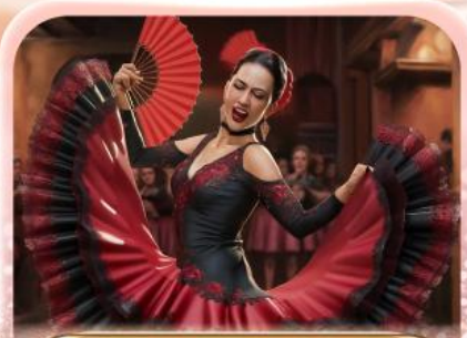
ระบำฟลามิงโก