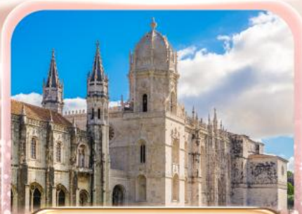
มหาวิหารเจโรนิโม