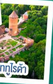
ปราสาทกูโรต้า