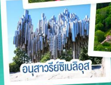
อนุสาวรีย์ซีเบลิอุส

ฟินแลนด์ - เอสโตเนีย - ลัตเวีย - ลิทัวเนีย แวะเที่ยวเซี่ยงไฮ้