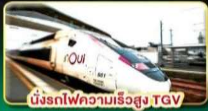
นั่งรถไฟความเร็วสูง TGV