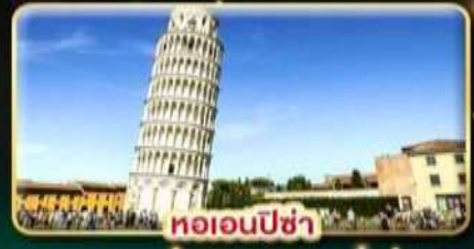
หออนปีซ่า