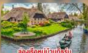
ล่องเรือหมู่บ้านทึร์น