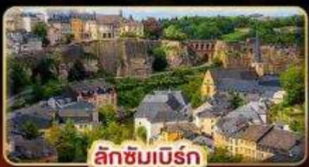
ลักซิมเบิร์ก

ที่สุดของธรรมชาติ แห่ง “ยุโรป” สวนดอกไม้ KEUKENHOF 1ปีมีครั้งเดียว