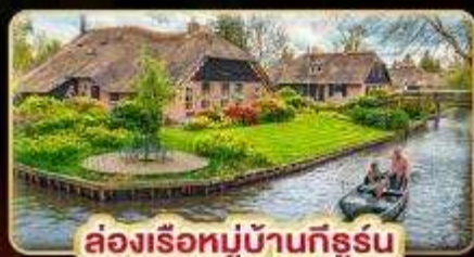
ล่องเรือหมู่บ้านทีร์ูร์น