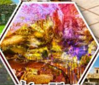
น้ำพอร์บรีอุส