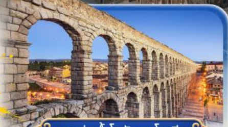
รางส่งน้ำโรมัน เซโกเวีย