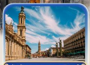
จัตุรัสพลาซ่า เดล ฟาร์