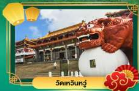
วัดเหวินทู่