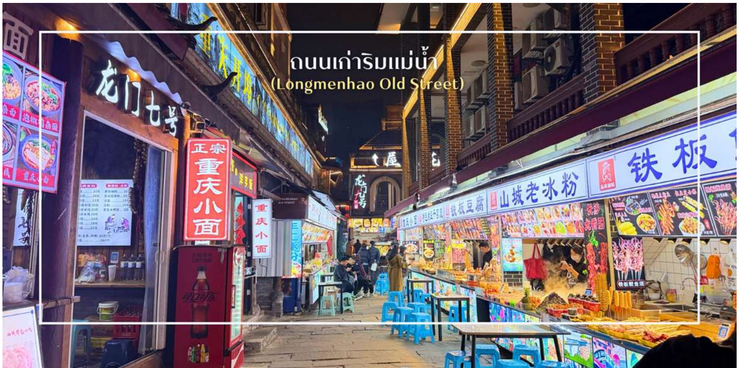
ถนนเก่าริมแม่น้ำ (Longmenhao Old Street)

จากนั้นนำท่านสู่ ถนนเก่าริมแม่น้ำ Longmenhao Old Street อีกหนึ่งแลนด์มาร์กสำคัญของเมืองฉงชิ่ง ตั้งอยู่ในเขตหนานอัน ริมฝั่งแม่น้ำแยงซี โดยถนนสายนี้เคยเป็นย่านการค้าและศูนย์กลางเศรษฐกิจที่รุ่งเรืองในยุคราชวงศ์หมิงและชิง ปัจจุบันได้รับการอนุรักษ์ไว้อย่างดี เพื่อเป็นแหล่งเรียนรู้ทางประวัติศาสตร์ และแหล่งท่องเที่ยวเชิงวัฒนธรรมที่เต็มไปด้วยเสน่ห์ บรรยากาศของถนนยังคงอบอวลไปด้วยกลิ่นอายวันวาน อาคารบ้านเรือนแบบโบราณ