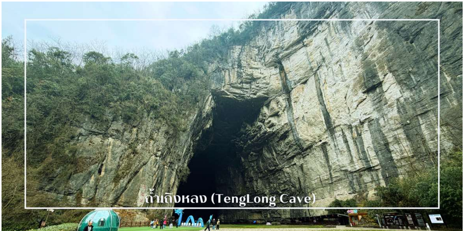
ถ้ำเถิงหลง (TengLong Cave)

นำท่านสู่ ถ้ำเถิงหลง (TengLong Cave) สถานที่ท่องเที่ยวระดับ 5A หนึ่งในถ้ำหินปูนที่ใหญ่และงดงามที่สุดของจีน ได้รับการขนานนามว่าเป็น ราชาแห่งถ้ำคาสต์ ด้วยความอลังการของธรรมชาติที่ก่อกำเนิดมากกว่า 300 ล้านปี ตัวถ้ำมีความยาวมากกว่า 50 กิโลเมตร แบ่งออกเป็นถ้ำแห้งและถ้ำเปียก ภายในเต็มไปด้วยหินงอกหินย้อยรูปร่างแปลกตา โถงถ้ำสูงใหญ่โอ่อ่า มีลำธารใสไหลผ่านกลางถ้ำ ตลอดเส้นทางยังมีการจัดแสงสีตระการตา เพิ่มบรรยากาศเสมือนเดินทางอยู่ในดินแดนแฟนตาซี