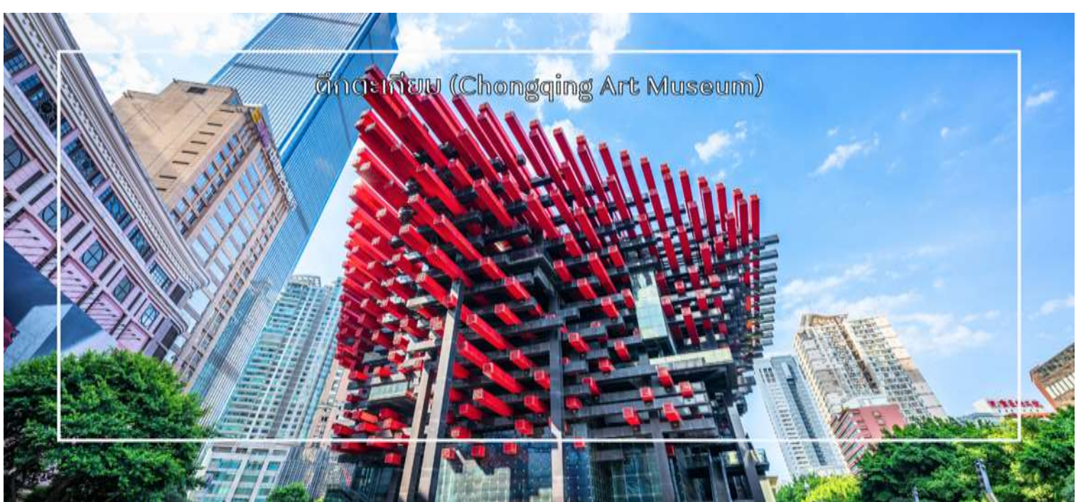
ตึกแกลเลียม (Chongqing Art Museum)