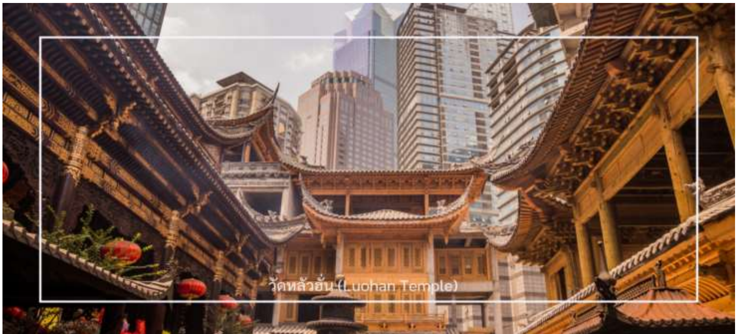
วัดหลัวฮั่น (Luohan Temple)

นำท่านเที่ยวชม วัดหลัวฮั่น (Luohan Temple) หรือที่เรียกว่า "วัดอรหันต์" เป็นวัดที่มีชื่อเสียงในเมืองฉงชิ่ง มีประวัติศาสตร์ยาวนานและมีความสำคัญในด้านศาสนาพุทธ วัดหลัวฮั่นมีพระพุทธรูปและรูปปั้นอรหันต์จำนวนมาก ซึ่งเป็นที่เคารพนับถือของผู้มาเยือน นอกจากนี้ยังมีบริเวณที่ให้ผู้เข้าชมสามารถทำบุญและสวดมนต์