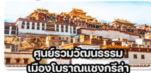
ศูนย์รวมวัฒนธรรมเมืองโบราณแชงกรีล่า