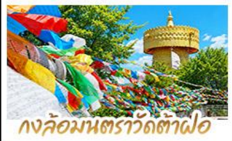
วงล้อมนตราวัดต้าฟ้อ

ถ่ายรูป MOOD ที่ใช้กันวิวทะเลสาบเอ๋อร์ไห่สุดโรแมนติก • ชมดอกไม้ตามฤดูกาลกลางขุนเขา ณ สวนอวาลูอว้าง พืชภูเขาหิมะมังกรหยกความสูงกว่า 4,506 เมตร (รวมกระเช้าใหญ่ไป-กลับ) • นั่งรถไฟขบวนวิวภูเขาหิมะมังกรหยก ชมวิวแบบพาโนรามา • เที่ยวเมืองโบราณต้าหลี่ ลี้เจียง แซงกรี่ล่า ซิม ซื่อปี้ ทะze กับวัฒนธรรมยูนนานกับเบต ชมธารน้ำขาวไปสู่งไถ UNSEEN เมืองจันทน์ยูนนาน • วัฒนาะซังจ้านหลิน สัมผัสกลิ่นอายอารยธรรมทิเบต vovpsกับงล้อมตราที่ใหญ่ที่สุดในจีน • ซ้อปิ้งเฟล็บ ณ ถนนคนเดินหนานมิงเจี๋ย & POP MART