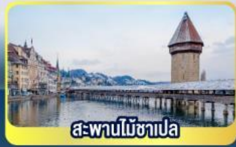
สะพานไม้ซาเปลา