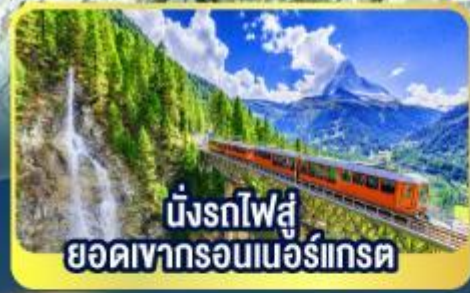
นั่งรถไฟสู่ ยอดเขารอนเนอร์เกรต