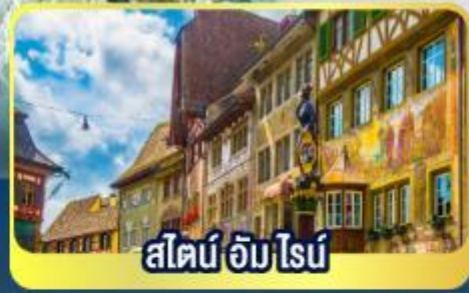
สไตน์ อัม ไรบ์