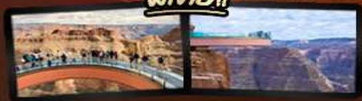
ชมความยิ่งใหญ่ของ GRAND CANYON WEST SKYWALK