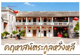
อุทยานวัฒนธรรมกุหล่งหวังเต๋สิ

ตามรอยภาพยนตร์สุดซึ้งแห่งปี "จดหมายรักถึงอาม่า" • เยี่ยมเมืองโบราณเต๋จิว ดินแดนต้นกำเนิดชาวจีนโพ้นทะเลที่อพยพสู่ประเทศไทย • เดินเล่นหมู่บ้านโบราณหลงหู สัมผัสบรรยากาศเต๋จิวดั้งเดิมราวกับหลุดเข้าไปในอีกหน • ชมย่านเมืองเก่าซิวเถาและ สวนสาธารณะเสี้ยวกงหยวน หนึ่งในสถานที่ที่ถ่ายทอดความรู้สึกความนิยมจากแฟนภาพยนตร์ ชมจดหมายโบราณอายุกว่าร้อยปี ณ พิพิธภัณฑ์จดหมายชาวจีนโพ้นทะเล