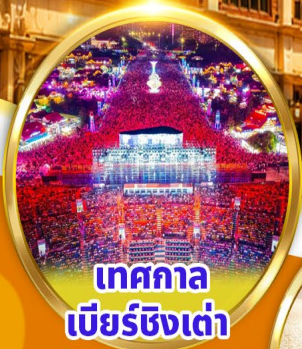
เทศกาล เบียร์ชิงเต่า