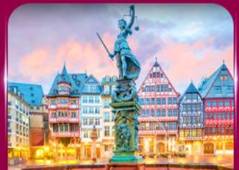
จัตุรัสโรเมอร์ แพรงก์เฟิร์ต