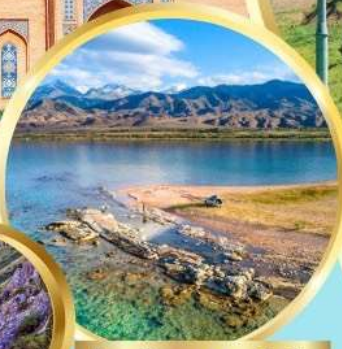
ล่องเรือทะเลสาบอิสซิค