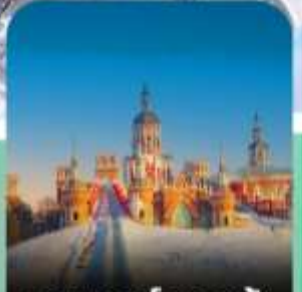
คฤหาสน์วอลก้า