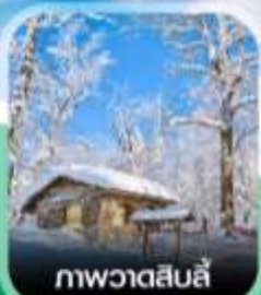
ภาพวาดสีบลู