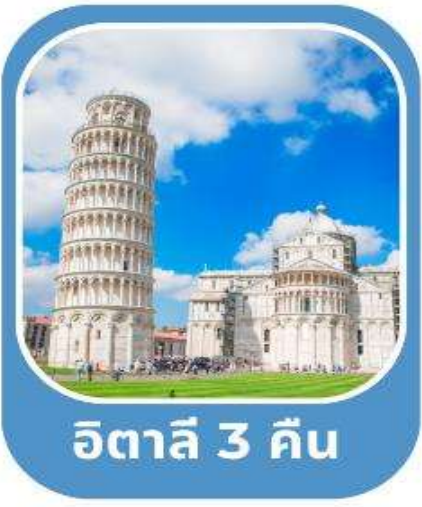
อิตาลี 3 คืน

โรม•นครรัฐวาติกัน•มหาวิหารเซนต์ปีเตอร์•โคลอสเซียม•น้ำพุเทรวี่•บันโดสเปน มอนเตคาดีนี•ปีซ่า•หอเอนเมืองปีซ่า•ล่องเรือเกาะเวนิส•ชมเมืองมิลาน•อินเทอร์ลาเคน เลาเทอร์บรุนเนน•พีชิตยอดเขาจุงเฟรา•ชมเมืองลูเซิร์น•ดัจอง•ปารีส เข้าชมพระราชวังแวร์ซายส์•ล่องเรือชมแม่น้ำแซนน์•ช้อปปิ้ง•มองมาร์ต