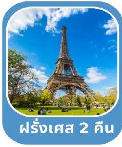
ฝรั่งเศส 2 คืน