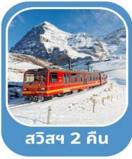
สวิสฯ 2 คืน