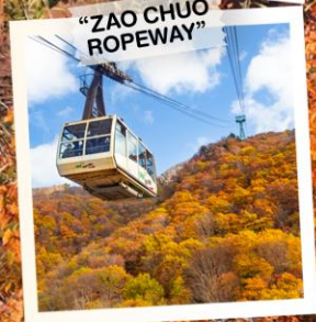
"ZAO CHUO ROPEWAY"