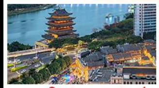
ถนนคนเดินสามตรอกสองซอย