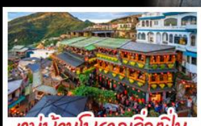
หมู่บ้านโบราณจีวเฟิน