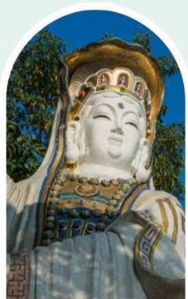
เจ้าแม่กวนอิม ธิพลสัย