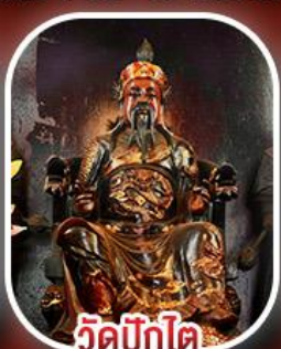
วัดปิกไต้