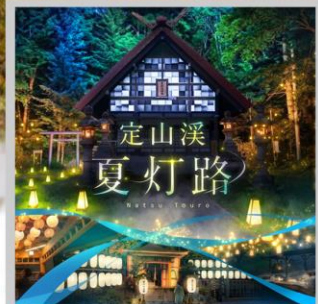
“JOZANKEI NATSU TOURO 2026”