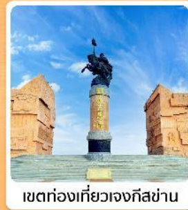
เขตท่องเที่ยวเจงกิสข่าน

ไฮไลท์ทะเลทรายอินเคินทาลา เขตท่องเที่ยวเจงกิสข่าน ทำเนียบพระลามะอูหลาน ตลาดตอนกลางคืนเมืองตาลาต่อ