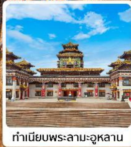
ทำเนียบพระลามะอูหลาน