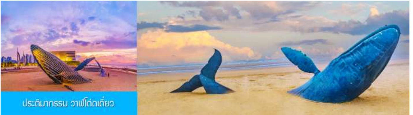
ประติมากรรม วาฬโด้เดี่ยว

นำท่านถ่ายภาพสุดสร้างสรรค์ที่ประติมากรรม วาฬเกยตื้น หรือวาฬโด้เดี่ยว 孤独的鲸 วาฬยักษ์ตัวนี้กำลังกระโดดขึ้นจากทะเล ซ่อนตัวอยู่ท่ามกลางทะเลป้อให้สับสน เป็นจุดถ่ายภาพยอดนิยมในช่วงน้ำ漲 ให้ท่านได้เก็บภาพ จุดไฮไลท์เป็นที่ระลึก