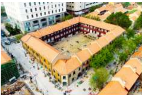
เมืองเก่าเยอรมัน ตรอกกว้างซิวหลี่