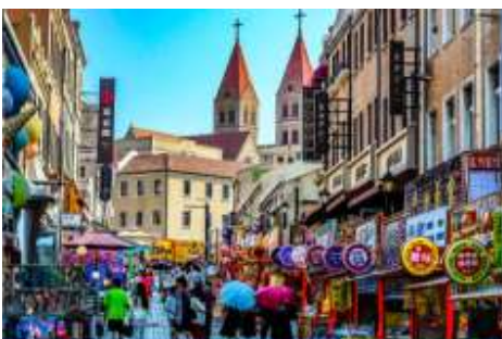
ถนนวงซาง