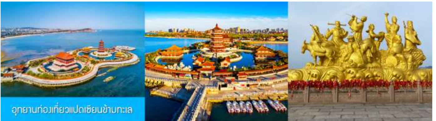
อุทยานท่องเที่ยวแปดเซียนข้ามทะเล