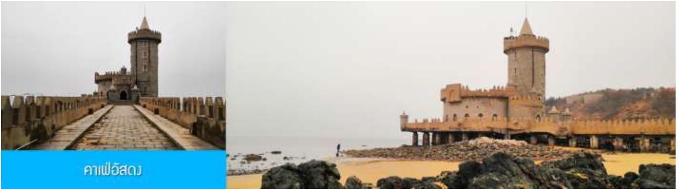
คาเฟ่อีสตว

จากนั้นนำท่าน เดินทางสู่ คาเฟ่อีสตว 落日古堡 นำท่านชมปราสาทในเทพนิยาย ที่ตั้งตระหง่านอยู่ริมชายหาด นานาชาติเว่ยไห่ คาเฟ่ที่ออกแบบด้วยสถาปัตยกรรมสไตล์ยุโรป ตัดกับวิวทะเลสีคราม และที่นี่คือแม่เหล็กดึงดูดนักท่องเที่ยวมาเก็บบรรยากาศความสวยงามความโรแมนติก (ตัวปราสาทเป็นร้านคาเฟ่ หากท่านต้องการเข้าไปด้านใน ต้องจ่ายค่าเครื่องดื่ม ตามเมนูของทางร้าน ซึ่งไม่รวมในอัตราค่าทัวร์)