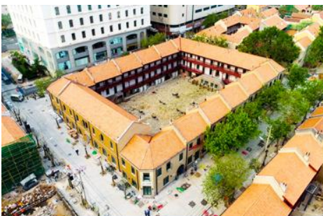
เมืองเก่าเยอรมัน ตรอกกว่างซิงหลี่