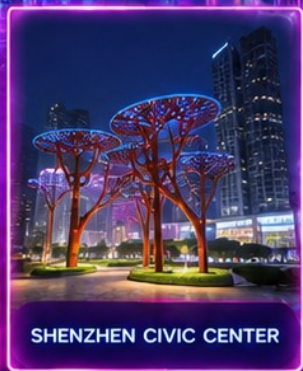
SHENZHEN CIVIC CENTER

ชมสถาปัตยกรรมระดับโลก พิพิธภัณฑ์ศิลปะร่วมสมัยเซินเจิ้น (MOCAPE) และ Shenzhen Civic Center