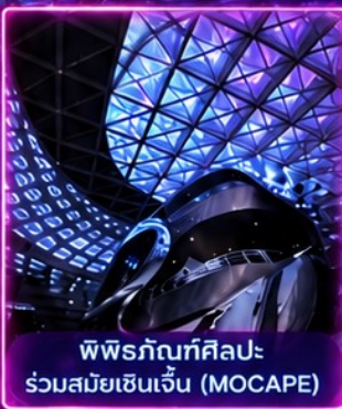
พิพิธภัณฑ์ศิลปะร่วมสมัยเซินเจิ้น (MOCAPE)