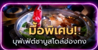
มือพิเศษ! บุฟเฟ่ต์ชาบูสโด้ฮ่องกง

UpperHills จุดถ่ายรูปสุดชิบของวัยรุ่นเซินเจิ้น - OCT Loft ย่าน Creative Park - OCT Harbour Happy Coast - Shenzhen Bay Culture Plaza - Cyberpunk พิพิธภัณฑ์ศิลปะร่วมสมัยเซินเจิ้น (MOCAPE) - Joy City Center (One Avenue) - Shenzhen Civic Center - shigu garden - วัดเจ้าแม่กวนอิม - วัดแชกงหมิว