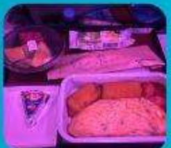
บริการอาหารร้อน ทั้งขาไป และ ขากลับ