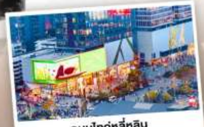
ถนนไท่กู๋หลี่หลิน