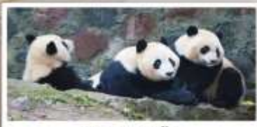
หุบเขาแพนด้า