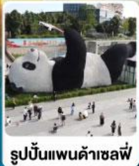
รูปปั้นแพนด้าเซลฟี่