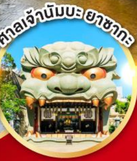
ศาลเจ้านิมะ ยาชากะ