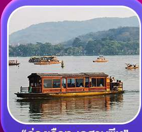
“ล่องเรือทะเลสาบซีหู”