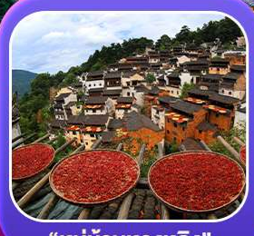
“หมู่บ้านหวงหลิง”

หุบเขาเทวดาวังเซียนกู่ หมู่บ้านที่ตั้งอยู่ริมหน้าผา • หมู่บ้านโบราณหวงหลิง ป่าสนน้ำชิงซาน • ล่องเรือทะเลสาบซีหู • ถนนโบราณตุ๋นจื่อ • ชมแสงสีที่ ฉู่หนีโจว