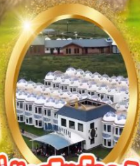
ที่พักสไตล์กระโจม