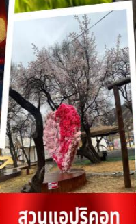
สวนแอปริคอต