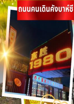
ถนนคนเดินคังบาร์ซี