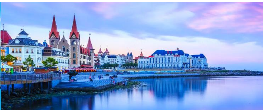
ท่าเรือชาวประมงไห่ซาง