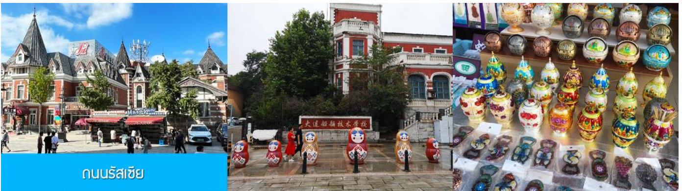
ถนนรัสเซีย

จากนั้นนำท่านขึ้น รถรางไฟฟ้า 有轨电车 เป็นรถรางไฟฟ้าที่สร้างขึ้นในปี ค.ศ. 1909 โดยบริษัทญี่ปุ่น (เมืองต้าเหลียนเคยตกเป็นเมืองขึ้นของญี่ปุ่นในปีค.ศ. 1900 – 1945 ) นำท่านนั่งรถรางโบราณผ่านชมตัวเมืองต้าเหลียน หนึ่งในเมืองแรก ๆ ที่มีบริการรถรางไฟฟ้าเปิดให้บริการในเขตเมือง ปัจจุบันมีเพียงสายที่ยังเปิดให้บริการในเมืองต้าเหลียน.