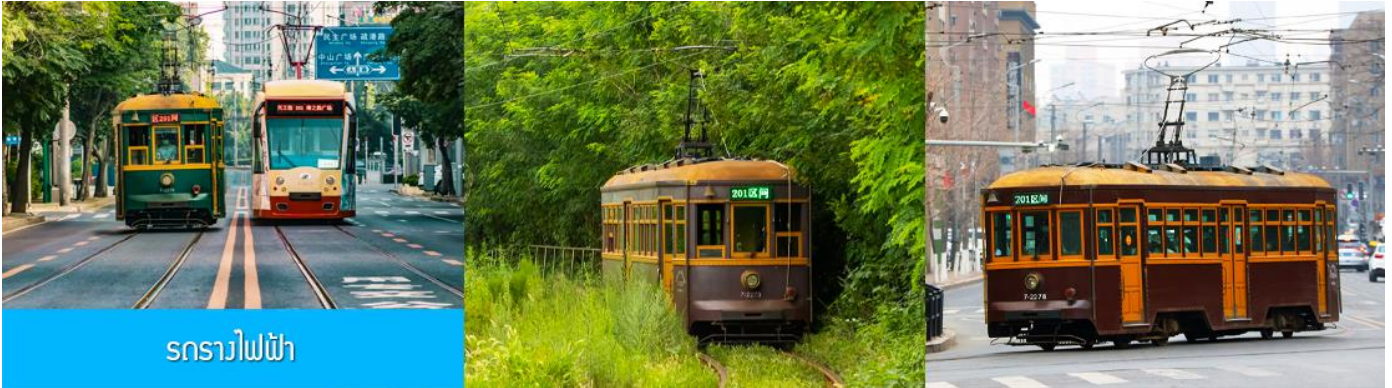
รถรางไฟฟ้า