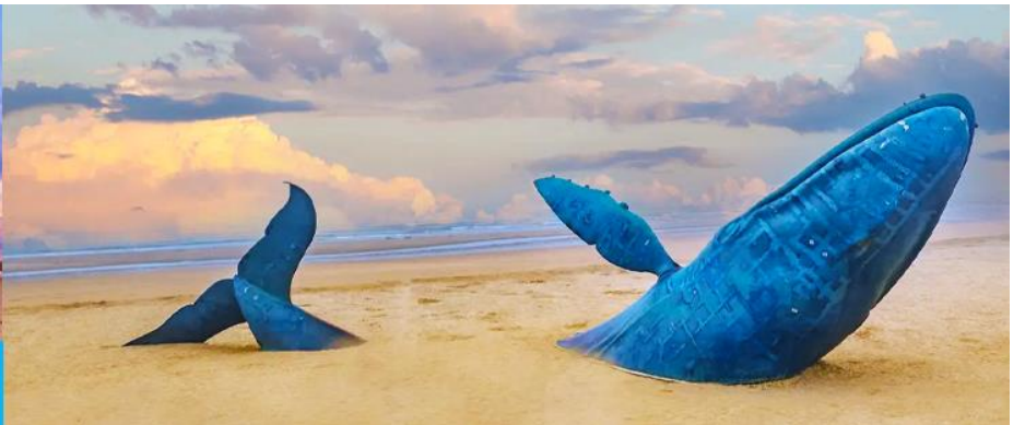
ประติมากรรม วาฬโดดเดี่ยว

นำท่านถ่ายภาพสุดสร้างสรรค์ที่ประติมากรรม วาฬเกยตื้น หรือวาฬโดดเดี่ยว 孤独的鲸 วาฬยักษ์ตัวนี้กำลังกระโดดขึ้นจากทะเล ซ่อนตัวอยู่ท่ามกลางทะเลป้อให้สับสนคราม เป็นจุดถ่ายภาพยอดนิยมในช่วงน้ำลง ให้ท่านได้เก็บภาพ จุดไฮไลต์ที่เป็นที่ระลึก