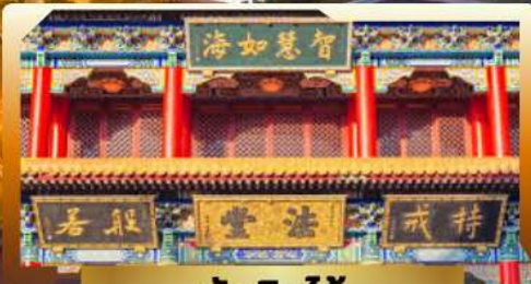
วัดจีนไท้