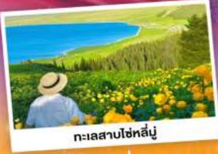
ทะเลสาบไซไห่ลู่

ถ่ายรูปทุ่งดอกลาเวนเดอร์ - กุ่งหนัวคาลาจัน SKY GRASSLAND กุ่งหนัวมรดกโลก