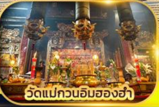
วัดแม่กวนอิมฮ่องอ่า