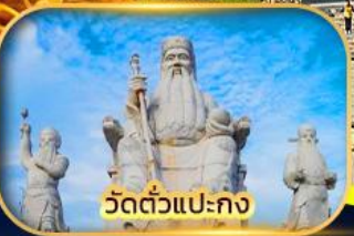
วัดตัวแปะกง