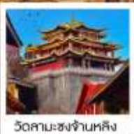
วัดสามะชงจ้านหลิง