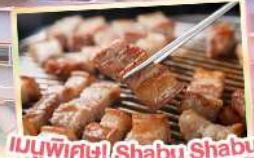
เมนูพิเศษ! Shabu Shabu และ BBQ สเต็กเกาหลี

เดินทาง พฤษภาคม - ตุลาคม 69 สายการบิน AIR BUSAN (BX) น้ำหนักกระเป๋า 15 KG