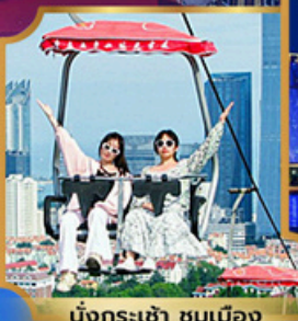
นั่งกระเช้า ชมเมือง