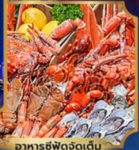
อาหารซีฟู้ดจัดเต็ม

บุฟเฟ่ต์เบียร์ไม่อื่น + ซีฟู้ด + บิงย่างเกาหลี