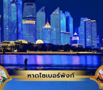
หาดโซเบอร์ฟังก์