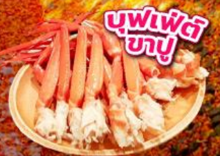
มิตซึย เอ้าท์เล็ต พาร์ค คิชะระชู