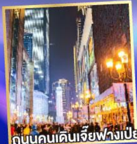
ถนนคนเดินเจียฟางเป่ย