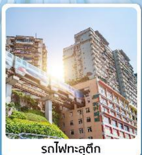
รถไฟฟ้าชุลติง

โอโห้! เที่ยวอุทยานแห่งชาติหลุมบ่อฟ้า มรดกโลกระดับ 5A ชมรถไฟทะเลสุดคูล อลังการแสงสีที่หงหยาดัง