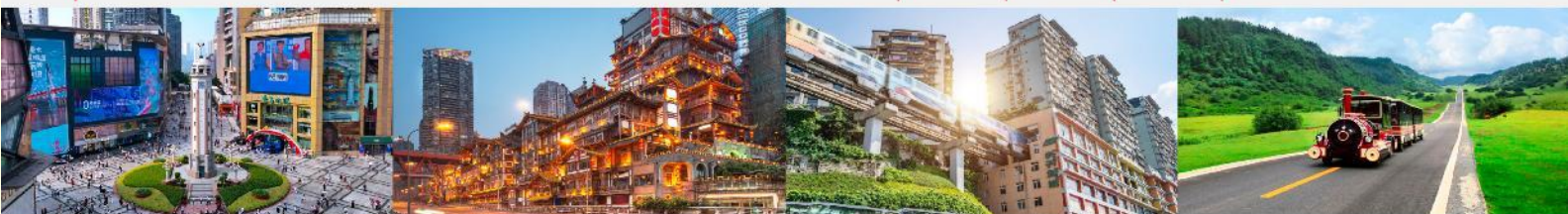
ถนนเจี๋ยฟางเป่ย์