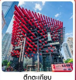
ตึกตะเกียบ

ไฮไลท์! เกี่ยวอุทยานแห่งชาติหลุมบ่อฟ้า มรดกโลกระดับ 5A ชมรถไฟฟ้าทะลุตึก อลังการแสงสีที่หงหยาดัง