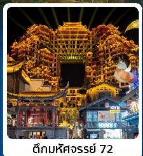
ตึกหอคจรรย 72