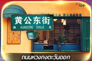
ถนนหวงกงตะวันออก