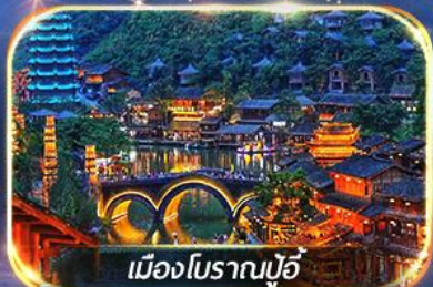
เมืองโบราณปู้จี้

สัมผัสบรรยากาศสุดโรแมนติก ณ หมู่บ้านปู้จี้ & ป่ากุเขามันหยอด เดินเล่น Wenlin Street ชมต้นแปะก๊วย & ถนนสายคาเฟ่สุดฮิต