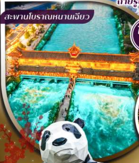
สะพานโบราณหนานเจียว

ชมความงดงาม สะพานโบราณหนานเจียว ระดับ 5A สักการะ วัดต้าสือ ถ่ายรูปแลนด์มาร์คดัง แพนด้ายักษ์เซลฟี และ แพนด้าป็นตึก