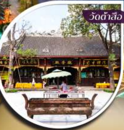
วัดต้าสือ