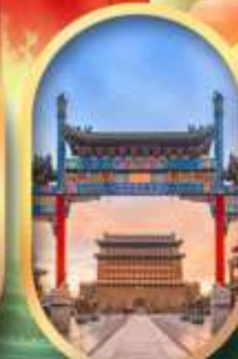
ถนนคนเดินเทียนเหมิน