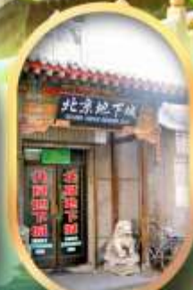
เมืองโบราณใต้ดิน