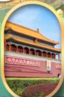
จัสมตรีสเทียนอันเหมิน