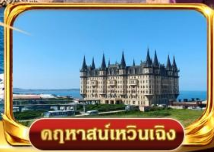
ดุหาสน์เหวินเจิง