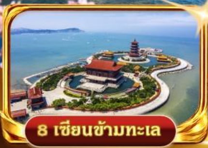
8 เซียนข้ามทะเล