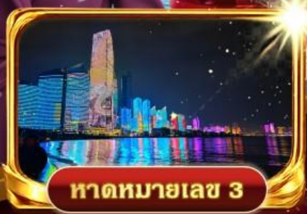
หาดหมายเลข 3