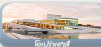
โอเปร่าเฮาส์

สักครั้งในชีวิตกับการนั่งรถไฟสายโรแมนติกฟลัมสบาน่า สองเรือชมฟยอร์ด ขึ้นกระเช้าล่องฟ้าพิชิตยอดเขาอูสริเคน เบอร์เกน นั่งรถรางสู้อดเขาฟลอเอนชมวิวเมือง ออสโล เยี่ยมชมโอเปร่าเฮาส์ มหาวิหารออสโล ป้อมปราการอาครส์ฮูส สวนอนุสรณ์ชาติ Vigeland Sculpture Park