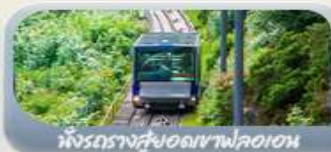
นั่งรถรางสู้อดเขาฟลอเอน